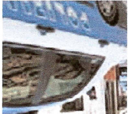
Pochi soldi. Anche la polizia fa i conti con i tagli. DNEWS

>> Il premier aveva minacciato un suo utilizzo negli atenei per sedare le "proteste violente" degli studenti contro i tagli del governo; per ora, anche la polizia torna in piazza, a sua volta contro i mandati stanziamenti per il 2009 da parte dell'esecutivo. Accadrà oggi anche a Verona, dove a partire dalle 9,30, nei pressi della prefettura, i sindacati di polizia distribuiranno volantini sui tagli previsti nella finanziaria alle risorse per il settore. Le organizzazioni lamentano minori risorse per un abbassamento del livello di sicurezza nel Paese», dicono. La protesta si svolge oggi nelle maggiori città italiane; aderiscono tutte le principali sigle sindacali. >>